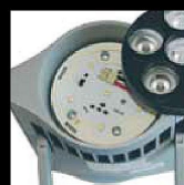
Nytt 16W High-Power LED-chip 1000 Lumen 3000K Ra 90+