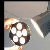
Enkelt att byta.