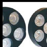
Frontlins smal, medium eller bredstrålande.