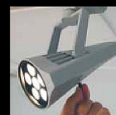
Inbyggd steglös dimmer.